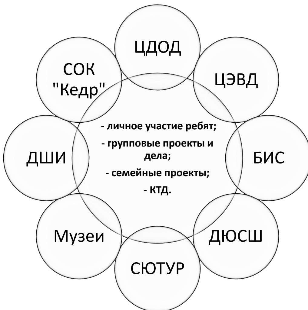
Рисунок 4 «Умландия» Сотрудничество участников программы с социальными партнерами

Таким образом, программа «Умландия» – это программа творческого развития младших школьников. Она позволяет организовать в школе внеурочную учебно-воспитательную работу, дополняя учебный процесс и создавая у ребёнка целостную картину восприятия мира. Программа направлена на развитие творческих способностей детей и обеспечивает эстетическое, физическое, нравственное, интеллектуальное развитие, познание жизни, самих себя, других людей с помощью активного вовлечения ребят в разнообразную игровую деятельность. Программа позволяет также решить основную проблему, связанную с необходимостью компенсации информационной перегрузки, с организацией психологического и физического отдыха.