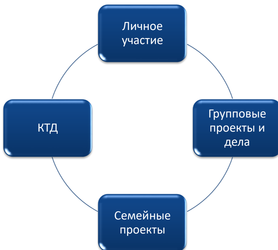
Способы взаимодействия участников программы

Интерес к игре также зависит и от того, как сформированы экипажи играющих. Здесь мы встречаемся с очень важным своеобразием массовых игр. Проводя соревновательную игру в параллели классов-городов, педагог организатор и старшие вожатые не должны заново комплектовать команды – они уже налицо: это города (классы) и экипажи внутри каждого класса. Город и экипаж – в большинстве своём сложившийся коллектив, спаянный общностью интересов, крепнувший в совместных делах. Нужно стремиться к тому, чтобы эти группы представляли собою коллективы, всегда готовые оспаривать первенство в различных играх и состязаниях.